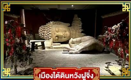
เมืองไคคินหวงฟูจิ่ง

“กำแพงหิมะ”...สิ่งมหัศจรรย์ของโลก พระราชวังต้องห้าม อดีตราชวังหลวงสุดยิ่งใหญ่