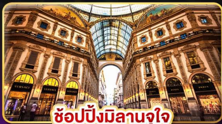
ช้อปปิ้งมิลานจุใจ

📅 เดินทาง : 9-16 ก.พ. / 9-16 มี.ค. / 23-30 มี.ค. 68