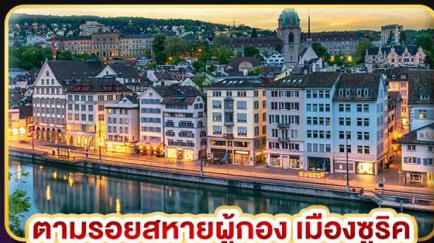
ตามรอยสหายผู้กอง เมืองซูริก