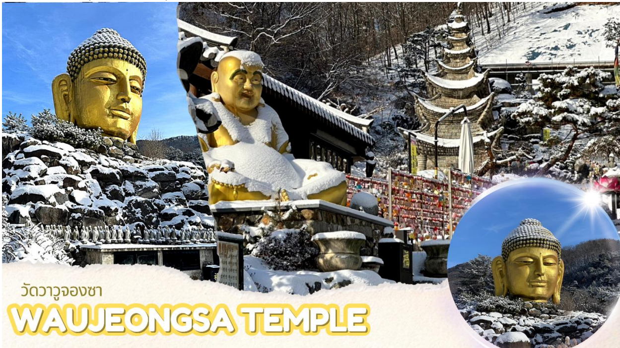
วัดวาจูองซา

นำท่านไป วัดวาจูองซา (Waujeongsa Temple) ตั้งอยู่ในเมืองยงอิน จังหวัดคยองกีโด เป็นวัดเก่าแก่ที่ตั้งอยู่กลางภูเขา มีเศียรพระพุทธรูปเจ้าขนาดใหญ่สีทองอร่ามดูโดดเด่น ซึ่งเป็นสัญลักษณ์ที่สำคัญของวัดนี้ เศียรพระพุทธรูปนี้มีความสูงถึง 8 เมตร วางตั้งอยู่บนกองหินขนาดใหญ่ วัดแห่งนี้สร้างขึ้นในปี ค.ศ. 1970 โดยนักบวชแสด็อกเพื่อแสดงการตอบแทนความเมตตากรุณาของพระพุทธรูปเจ้าในการรวมประเทศเกาหลีเหนือและเกาหลีใต้