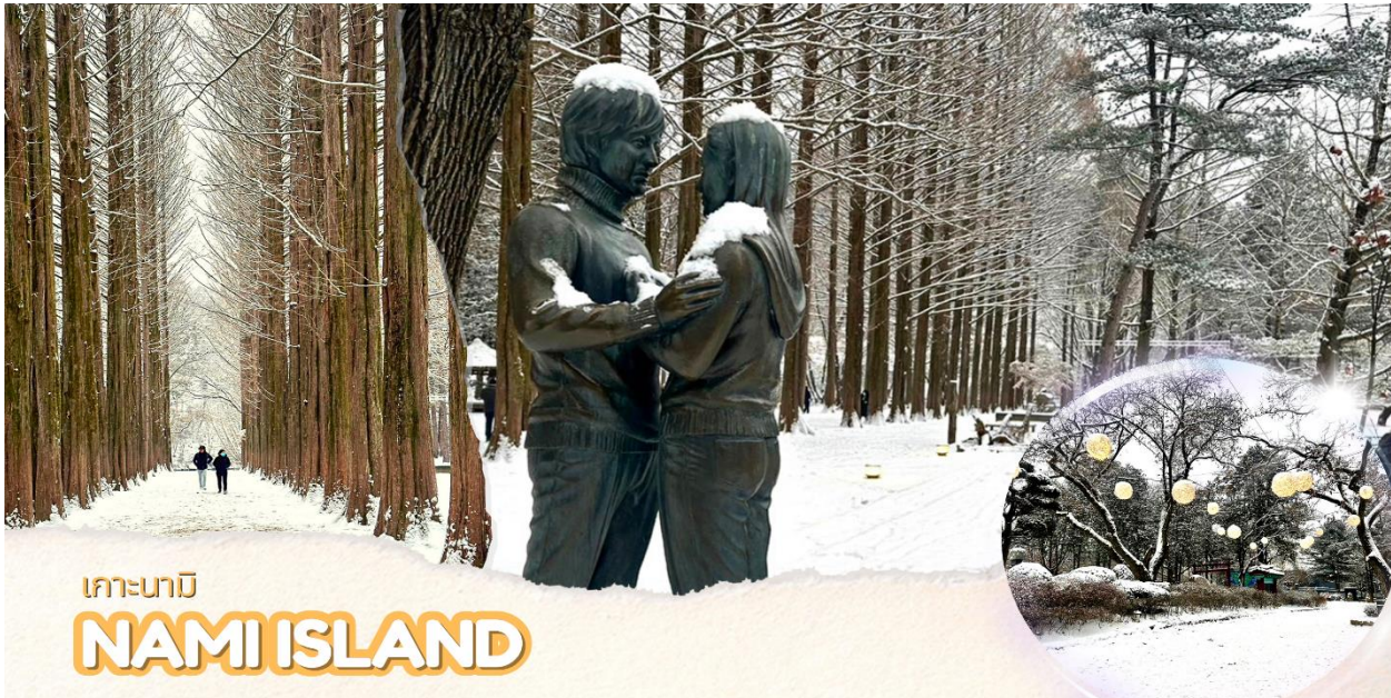
เกาะนามิ NAMI ISLAND

จากนั้นออกเดินทางสู่ เมืองซุนชอน ตั้งอยู่ในจังหวัดคังวอนโด ผู้คนยังคงวิถีชีวิตแบบบ้านๆซึ่งจะแตกต่างจากกรุงโซลเมืองหลวงของเกาหลีที่เต็มไปด้วยแสงสีเสียงหลายคนถ้าได้ยินชื่อเมืองซุนชอนคงไม่รู้จักและไม่รู้ว่าอยู่ส่วนไหนของเกาหลีแต่ถ้าบอกว่าเกาะนามิทุกคนก็คงร้องออกมาว่าอ้ออย่างแน่นอน นำท่านเดินทางสู่ เกาะนามิ นั่งเรือเฟอร์รี่ข้ามไปโดยใช้เวลาประมาณ 10 นาที เกาะนามิ แหล่งท่องเที่ยวที่มีชื่อเสียงของเกาหลีใต้ที่สามารถท่องเที่ยวได้ทั้งปี ตั้งอยู่กลางทะเลสาบชองเพียง บนเกาะจะมีบรรยากาศร่มรื่นเต็มไปด้วยต้นสน ต้นเกาลัด ต้นแปะก๊วย ต้นซากุระ ต้นเมเปิ้ล และต้นไม้ดอกไม้อื่นๆที่ผลัดกันออกดอกเปลี่ยนสีให้ชมกันทุกฤดูกาล บรรยากาศหนาวๆ มีหิมะปกคลุมก็จะอยู่ในช่วงเดือนธันวาคม-มกราคม เกาะนามิโด่งดังจาก ซีรีส์เรื่อง Winter Love song โดยใช้เกาะนามิเป็นสถานที่ถ่ายทำ มีคู่รักมากมายมักไม่พลาดที่จะมาถ่ายรูปกับจุดไฮไลต์บนเกาะสุดโรแมนติก Winter Sonata's First Kiss รูปปั้นคู่พระ-นาง จาก ซีรีส์เรื่องดัง ใกล้กันนั้นยังมีโซนอาหารทั้งร้านอาหารแบบนั่งทาน ร้านปิ้งย่าง และซาลาเปาหนึ่งเตาถ่านแบบโบราณ