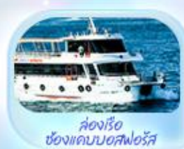
ล่องเรือ ช่องแคบบอสฟอรัส