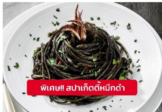
พิเศษ!! สปาเก็ตตี้หมีดำ

Highlight! เมื่อเยือนเกาะเวนิส เมนูที่ขึ้นชื่อและหากได้มาต้องได้ลิ้มลองสปาเก็ตตี้ผัดซอสหมีดำที่คลุกเคล้ากับความหอมนุ่มนัวกับบรรยากาศ สุดคลาสสิคฉบับอิตาเลียนต้นตำรับเวนิส