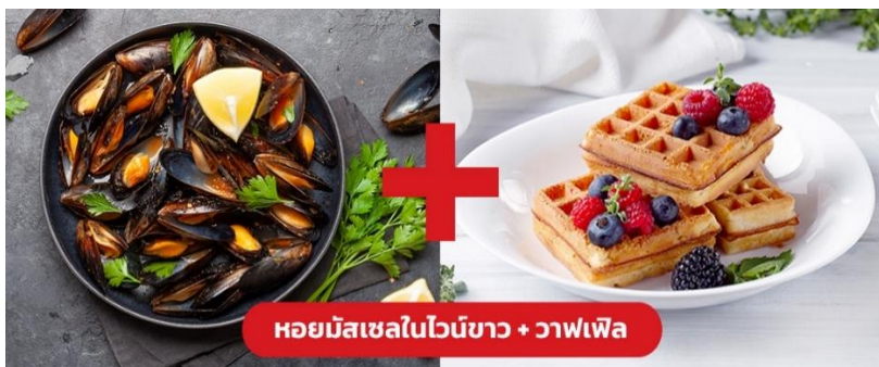
หอยมัสเซลในไวน์ขาว + วาฟเฟิล

Highlight! หอยมัสเซลอบมาในซอสไวน์ขาวสุดกลมกล่อมผสานกับความหวานของหอย เสิร์ฟพร้อมคู่กับเบลเยียม วาฟเฟิล (Belgain Waffle) เป็นเมนูตัดเลี่ยนที่ทานแล้วลงตัวสุดๆ 😊