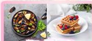
เมนูพิเศษ หอยมีสเซล+วาฟเฟิล