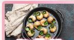
เมนูพิเศษ หอยออสตาโก