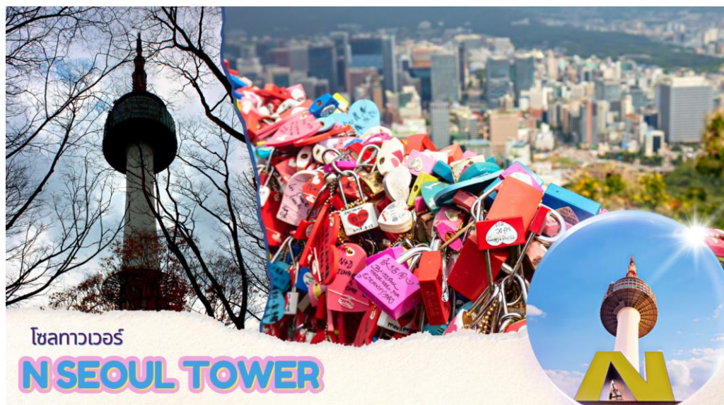
โซลทาวเวอร์ N SEOUL TOWER

นำคณะขึ้น ภูเขาหนัมซาน เป็นที่ตั้งของ หอคอยเอ็น โซลล์ทาวเวอร์ (N SEOUL TOWER) 1 ใน 18 หอคอยเมืองที่สูงที่สุดในโลก มีความสูงถึง 480 เมตร เหนือระดับน้ำทะเล ท่านสามารถชมทัศนียภาพของกรุงโซลจากยอดโซลทาวเวอร์ได้รอบทิศ 360 องศา โดยสามารถมองได้ถึงเขาพุกกักซัน และถ้าหันไปยังทิศตรงข้าม ก็จะได้เห็นไกลไปถึงแม่น้ำฮันกิง เป็นอีกหนึ่งสถานที่ที่สวยแสนจะโรแมนติก ไม่ว่าจะเป็นยามกลางวันหรือกลางคืน และไม่ว่าจะฤดูไหนๆ ที่นี่ยังคงได้รับความนิยมเสมอมา เพราะเป็นสถานที่คล้องกุญแจคู่รักที่ยอดนิยมของนักท่องเที่ยว และชาวเกาหลี โดยมีความเชื่อว่าหากได้มาคล้องกุญแจด้วยกันที่นี่ และโยนลูกกุญแจลงไปแล้วจะทำให้รักกันมั่นคง ยืนยาว ราบรื่นเท่านั้น ** ยังไม่รวมค่าขึ้นลิฟต์ และ ค่าแม่กุญแจ ลูกกุญแจ คู่รักสำหรับคล้อง ท่านสามารถเตรียมจากประเทศไทยไปได้ **