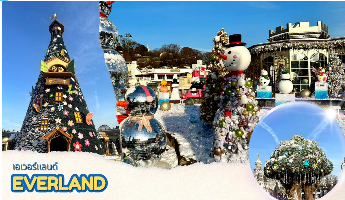
เอเวอร์แลนด์ EVERLAND

นำคณะขึ้น ภูเขาหนัมซาน เป็นที่ตั้งของ หอคอยเอ็น โซลล์ทาวเวอร์ (N SEOUL TOWER) 1 ใน 18 หอคอยเมืองที่สูงที่สุดในโลก มีความสูงถึง 480 เมตร เหนือระดับน้ำทะเล ท่านสามารถชมทัศนียภาพของกรุงโซลจากยอดโซลทาวเวอร์ได้รอบทิศ 360 องศา โดยสามารถมองได้ถึงเขาพุกกักซัน และถ้าหันไปยังทิศตรงข้าม ก็จะได้เห็นไกลไปถึงแม่น้ำฮันกิง เป็นอีกหนึ่งสถานที่ที่สวยแสนจะโรแมนติก ไม่ว่าจะเป็นยามกลางวันหรือกลางคืน และไม่ว่าจะฤดูไหนๆ ที่นี่ยังคงได้รับความนิยมเสมอมา เพราะเป็นสถานที่คล้องกุญแจคู่รักที่ยอดนิยมของนักท่องเที่ยว และชาวเกาหลี โดยมีความเชื่อว่าหากได้มาคล้องกุญแจด้วยกันที่นี่ และโยนลูกกุญแจลงไปแล้วจะทำให้รักกันมั่นคง ยืนยาว ราบรื่นเท่านั้น ** ยังไม่รวมค่าขึ้นลิฟต์ และ ค่าแม่กุญแจ ลูกกุญแจ คู่รักสำหรับคล้อง ท่านสามารถเตรียมจากประเทศไทยไปได้ **