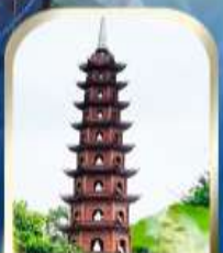
ทัวร์พระซอพร ชมเจดีย์พันปีเงินทิวัก