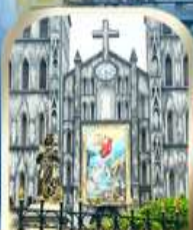
เช็กอินฮานอย โบสถ์เซนต์โจเซฟ