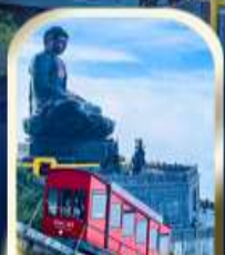
เลือกซื้อตั๋วเสริม ขึ้นยอดซาฟานซิปัน