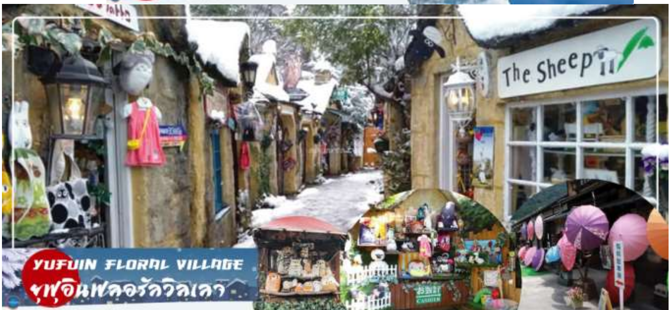
YUFUIN FLORAL VILLAGE