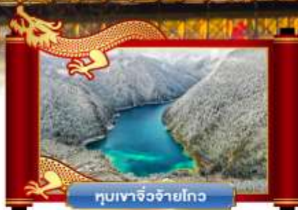
หุบเขาจิวจ้ายโกว