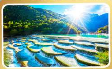
หุบเขาพระจันทร์สีน้ำเงิน