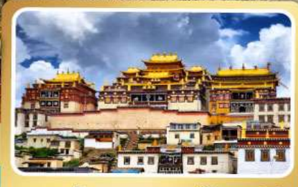
วัดลามะชงจ้านหลิง