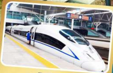
รถไฟความเร็วสูง