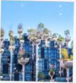
Tian An 1,000 Trees Square