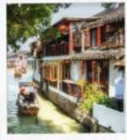
เมืองโบราณจูเจียเจี้ยว