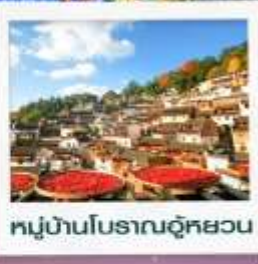
หมู่บ้านโบราณอู่หยวน