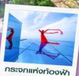
กระเจกกห่งก้องฟ้า