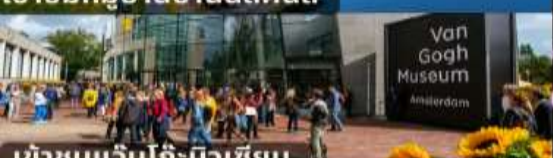
เข้าชมแวนโก๊ะมิวเซียม