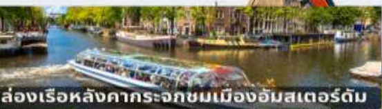
ล่องเรือหลังคากระจกชมเมืองอัมสเตอร์ดัม