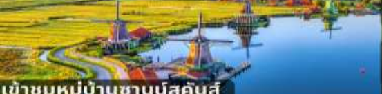
เข้าชมหมู่บ้านชานส์คินส์