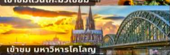
เข้าชม มหาวิหารโคโลญ