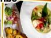
อาหารไทย ในยุโรป

บริการ FULL SERVICE น้ำหนักกระเป๋า 30 kg.