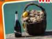
ของว่างรสดี กับไวน์ขาว