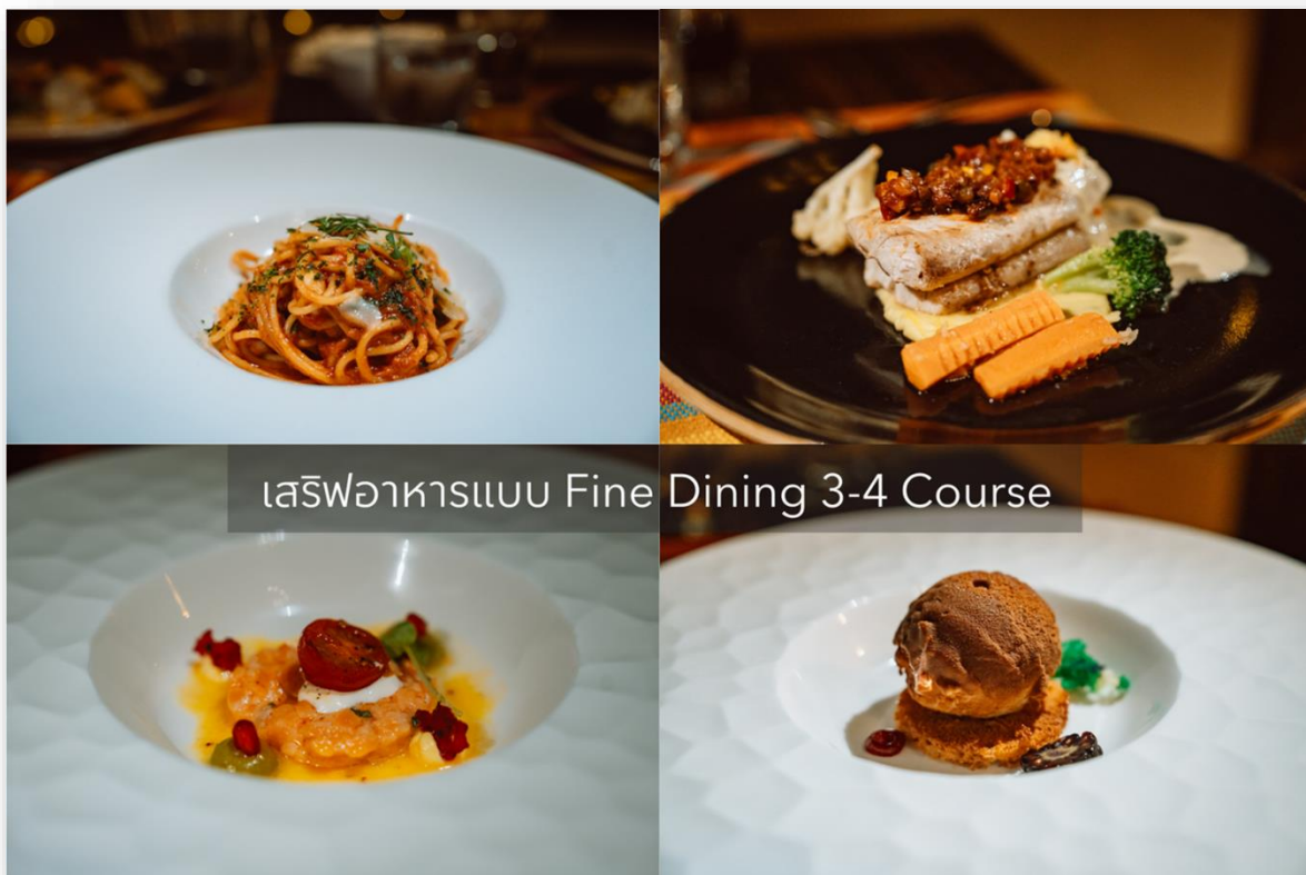
เสิร์ฟอาหารแบบ Fine Dining 3-4 Course