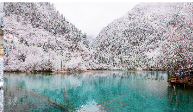
อุทยานแห่งชาติจิวจ้ายโก

*ทางบริษัทฯ ขอสงวนสิทธิ์ในการสลับโปรแกรมทัวร์ตามความเหมาะสมขึ้นอยู่กับสถานการณ์หน้างาน โดยคำนึงถึงผลประโยชน์ของลูกค้าเป็นสำคัญ