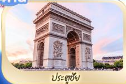
ประตูชัย