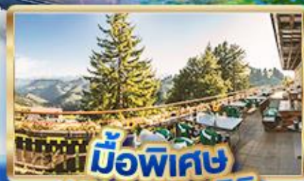
มือพิเศษ บนยอดเขารัก