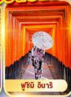
ฟูชิมิ อินาริ