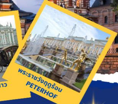
พระราชวังฤดูร้อน PETERHOF