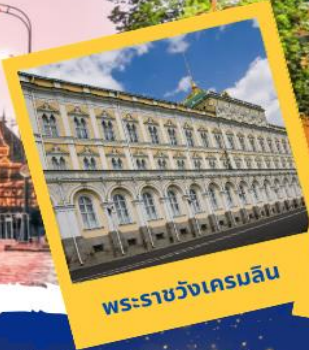
พระราชวังเครมลิน

เกี่ยวครบ 4 พระราชวัง รวมค่าเข้าชมทุกสถานที่!!