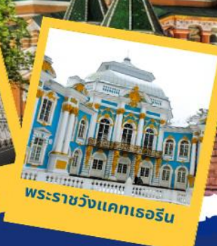
พระราชวังแคทเธอรีน