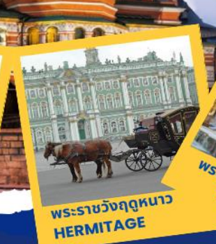
พระราชวังฤดูหนาว HERMITAGE