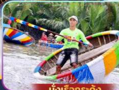
นั่งเรือกระดิง