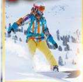
ลานสกีซิกิไซ