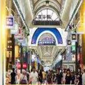
ย่านสุซุกิโนะ