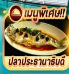
ปลาประธาราธิบดี