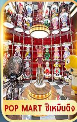
POP MART ซีเหมินติง