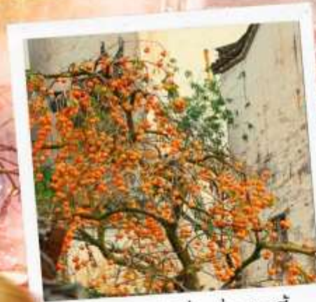
柿柿如意 ชื่อ ชื่อ หยูอี้ ลูกพลับแห่งความราบรื่น