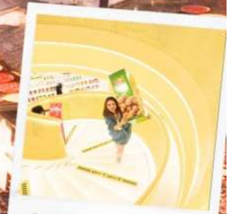
SNACK BUSY STATION