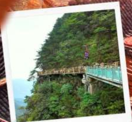
หมิงเยวี่ยซาน