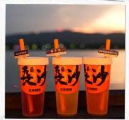
เซียงเจียงริเวอร์ไซด์