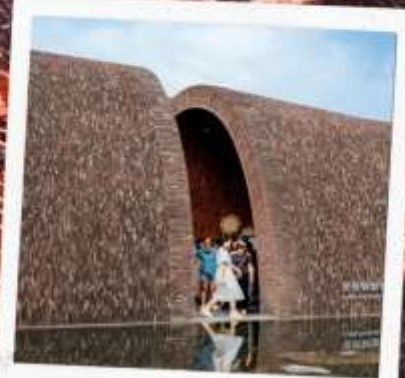
จิ่งเต้อเจิ้น