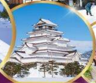
ปราสาท สึรุกะ