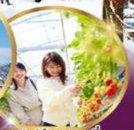
บูฟเฟ่ต์ สดอบอร์ เก็บสดจากต้น