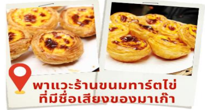
พาแวะร้านขนมทาร์ตไข่ ที่มีชื่อเสียงของมาเก๊า

สถานที่นี้โดดเด่นไปด้วยสถาปัตยกรรมตะวันตก ตกแต่งด้วยเสาแบบโรมันและรูปปั้นนักบุญสำคัญของศาสนาคริสต์ แต่เดิมเป็นโบสถ์ที่ใหญ่ที่สุดในมาเก๊า สร้างขึ้นตั้งแต่ปี ค.ศ. 1602-1637 เพื่อเป็นศูนย์รวมแรงศรัทธาของชาวคริสต์ แต่แล้วก็เกิดเหตุไฟไหม้จากห้องครัวของโบสถ์เมื่อปี ค.ศ. 1835 ลุกลามไปทั่วจนทำให้ตัวโบสถ์พังทลาย เหลือเพียงส่วนหน้าประตูที่ยังไม่ถูกทำลาย จนกระทั่งปี ค.ศ. 1991 ที่มีการบูรณะซากประตูโบสถ์อีกครั้ง ทำให้ที่นี่กลายเป็นหนึ่งในสถานที่ท่องเที่ยวที่มีความสำคัญต่อประวัติศาสตร์มาเก๊า และได้รับการยกย่องให้เป็นมรดกโลก