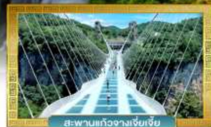
สะพานแก้วจางเจียเจีย

เดินทางโดย: สายการบินเวียดนามแอร์ไลน์ (VZ)