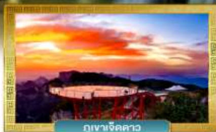
กุเวาเจ็ดดาว