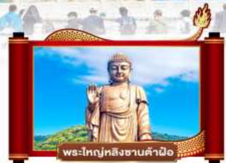
พระใหญ่หลงซานคำมือ