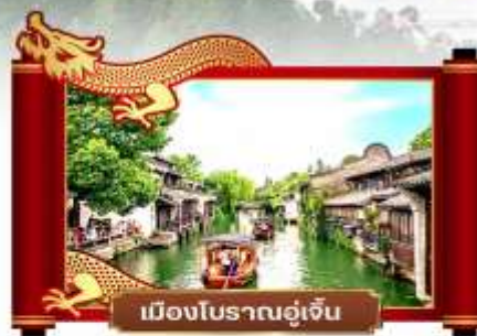
เมืองโบราณอู๋เจิน