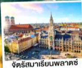
จัตุรัสมาเรียนพลาตซ์

15-21 ต.ค. 67 28 ก.พ.-06 มี.ค. / 12-18 มี.ค. 68 28 มี.ค.-03 เม.ย. / 03-09, 10-16 เม.ย. 68 25 เม.ย.-01 พ.ค. / 29 เม.ย.-05 พ.ค. 68