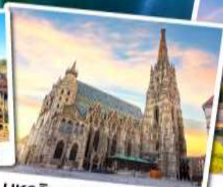
มหาวิหารเซนต์สตีเฟน