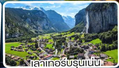
ลาเกอร์บรุนเนน

เดินทาง 12-18 มี.ค. 68 28 มี.ค.-03 เม.ย. 68 10-16 เม.ย. 68 29 เม.ย.-05 พ.ค. 68