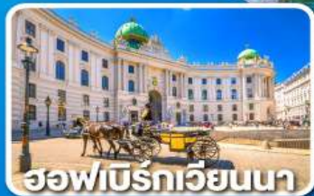
ฮอฟเบิร์กเวียนนา