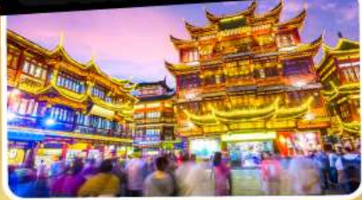
ตลาดร้อยปีอิงหวังเมี่ยว