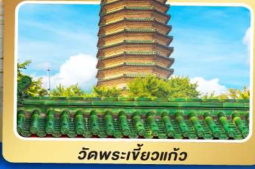
วัดพระเจี๊ยะท้าว

เมนูพิเศษ เปิดปักกิ่ง, ซามูหม้อไฟ อาหารกวางตุ้ง, อาหารเสฉวน