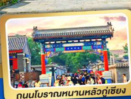
ถนนโบราณหนานหลิวกู่เซียง