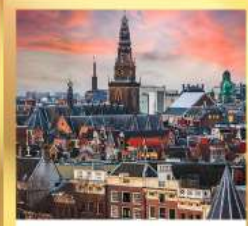
อัมสเตอร์ดัม