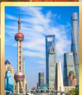
เซี่ยงไฮ้