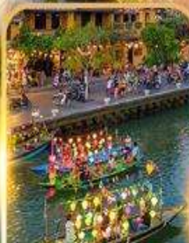
ล่องเรือลอยกระทง