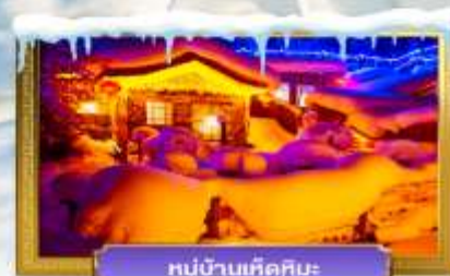
หมู่บ้านเห็ดหิมะ

เดินทางโดย : สายการบินเซินเจิ้นแอร์ไลน์ (ZH)