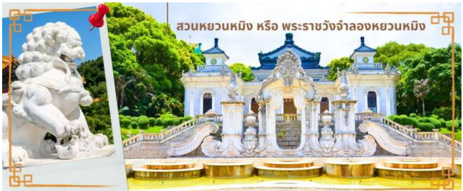
สวนหยวนหมิง หรือ พระราชวังจำลองหยวนหมิง

จากนั้นนำท่านสู่ ร้านหยก หยกในจินโบราณจนมาถึงสมัยนี้ ยังมีความเชื่อว่าเป็นอัญมณีที่ล้ำค่าและหายาก บ่งบอกฐานะของสตรีในสมัยก่อน แต่ในสมัยนี้ เชื่อกันว่าหยกสีเขียวนั้นเหนี่ยวนำโชคและความร่ำรวย ดังคำกล่าวที่ว่า“สีเขียวเหนี่ยวทรัพย์” ถือเป็น การเสริมดวงจัญที่ดีของผู้สวมใส่อิสระให้ท่านได้เรียนรู้ชนิดของหยกและเลือกซื้อตามใจชอบจากนั้นนำท่านสู่ สวนหยวนหมิง หรือ พระราชวังจำลองหยวนหมิง ตั้งอยู่ ณ ใจกลางหุบเขาซีลีน เมืองจูไห่ สร้างขึ้นเลียนแบบพระราชวังหยวนหมิง ณ กรุงปักกิ่ง สิ่งก่อสร้างต่างๆ มากกว่า 100 ชิ้น มีขนาดเท่าของจริงในอดีตทุกชิ้น อาทิ เสาหินคู่ สะพานข้ามธารทอง ประตูต่างง ตำนั้กเจิ้งต้ากวางหมิง สะพานแก้วเสี้ยว