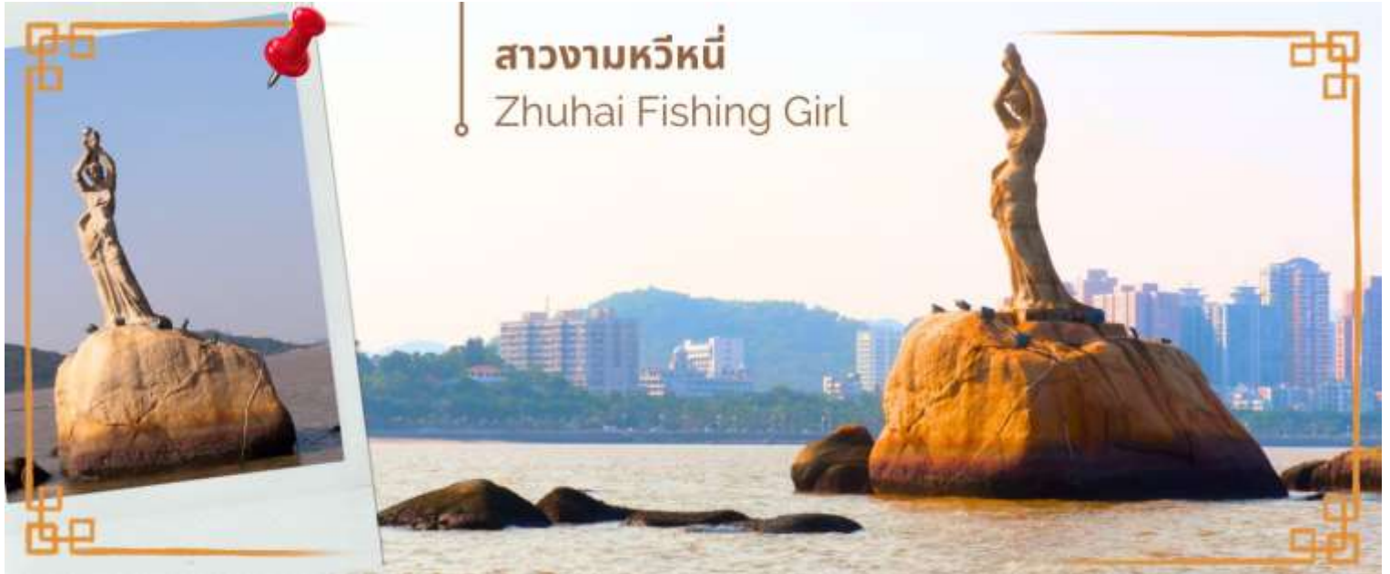
สาวงามหวีหน้