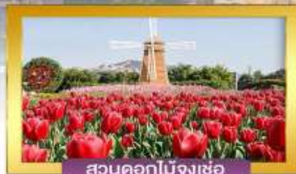
สวนดอกไม้จางเซอ