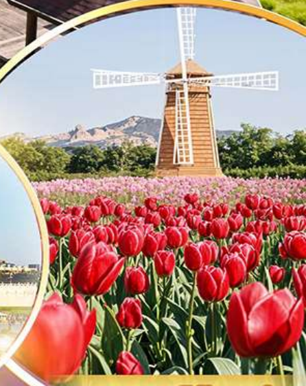
สวนดอกไม้จางเซ่อ