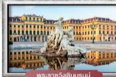
พระราชวังเซ็นบรุนน์