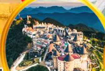
ฝรั่งเศสแห่งดานัง พักบนบานาฮิลล์ 1 คืน