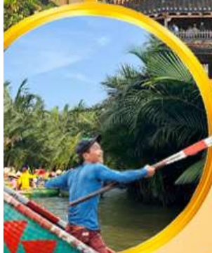
นั่งเรือกระดิง