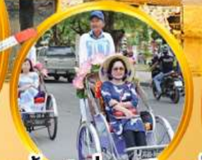
สามล้อซิคเล่..ชมเมืองเก่า