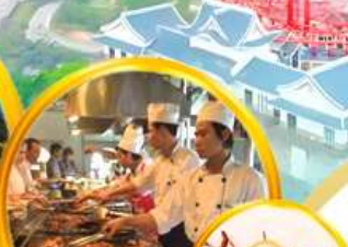
บุฟเฟ่ต์นานาชาติ + มื้อพิเศษทุ่งมังกร