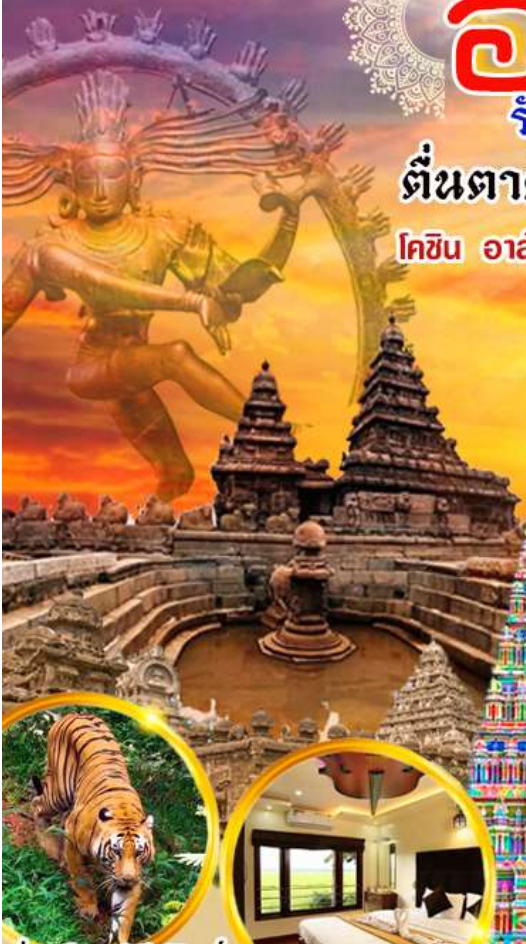
ล่องเรือซาฟารีเปริยาร์