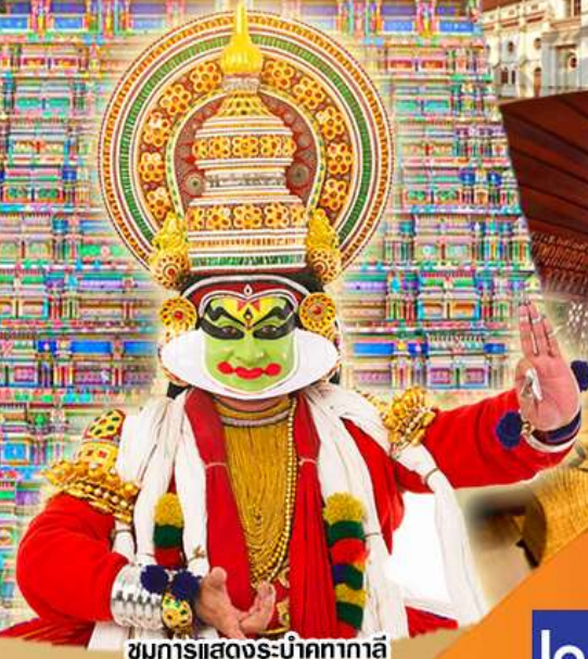
ชมการแสดงระบำคทากาลี