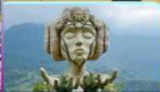
Moana Sapa Cafe