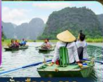
นั่งเรือกระจาด