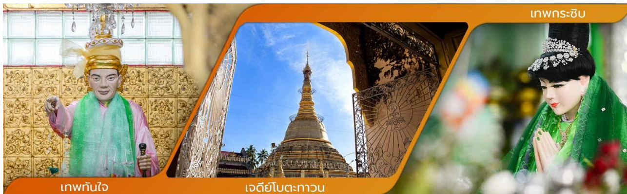
เทพทันใจ

คำบูชาเทพทันใจ เอหิ สักกะ มหานัทโปะโปะจีโปตะถ่องสิทธิมัตถุ อิทังพะลัง เอตัสสะมิงรัตตะนัง พุทฺธัง อัมมัง สังฆัง เทวานัง ประสิทธิลาโภ ชโยนิจจัง วันทามิสัพพะทา สวาโหม