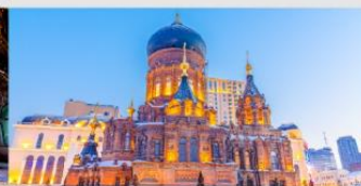
โบสถ์เซนต์ไอแซค

*ทางบริษัทฯ ขอสงวนสิทธิ์ในการสลับโปรแกรมทัวร์ตามความเหมาะสมขึ้นอยู่กับสถานการณ์หน้างาน โดยคำนึงถึงผลประโยชน์ของลูกค้าเป็นสำคัญ