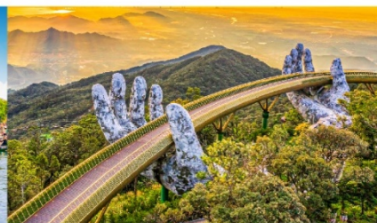
บานาฮิลล์

*กรณีห้องพักบานาฮิลล์เต็ม ขอสงวนสิทธิ์ในการเปลี่ยนวันเข้าพัก และปรับเปลี่ยนโปรแกรมโดยคำนึงถึงผลประโยชน์ลูกค้าเป็นสำคัญ