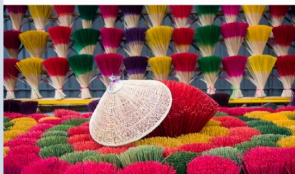
หมู่บ้านรูปหลากสี