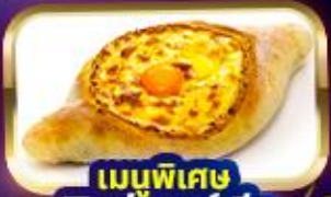
เมนูพิเศษ พิซซ่าจอร์เจีย Khachapuri

การ์ันตี 15 ท่านออกเดินทาง พร้อมหัวหน้าทัวร์คนไทย