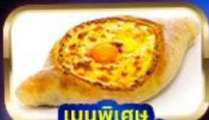
เมนูพิเศษ พิซซาจอร์เจีย Khachapuri

การ์นิตี 15 ท่านออกเดินทาง พร้อมหัวหน้าทัวร์คนไทย