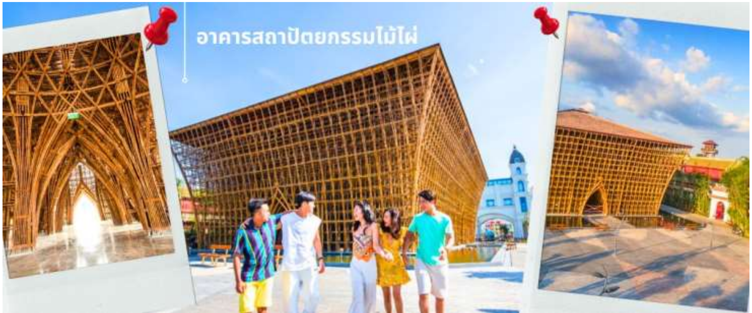
อาคารสถาปัตยกรรมไม้ไฟ

จากนั้นนำท่านเฟลิตเฟลิตไปกับศูนย์รวมความบันเทิงและช้อปปิ้ง GRAND WORLD PHU QUOC ท่านจะได้พบกับร้านค้า ทั้งร้านอาหาร และของฝากมากมาย ที่รายล้อมไปด้วยบรรยากาศของสถาปัตยกรรมสไตล์เวนิส ด้วยอาคารหลากสี ทำให้รู้สึกตื่นเต้น และยังเป็นศูนย์รวมนักท่องเที่ยว ทั้งชาวเวียดนามและชาวต่างชาติ ทำให้ใครหลายคน ชนานนามเมืองแห่งนี้ว่า เมืองที่ไม่เคยหลับใหล The Sleepless Festival City พร้อมด้วยการแสดงโชว์สุดอลังการ กลางแจ้งที่จัดแสดงทุกวัน วันละ 1 รอบ ใจกลางเมือง Grand World