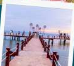
Sunset Sanato Beach Club