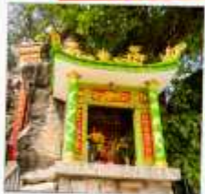
ศาลเจ้าดิ้งขาว