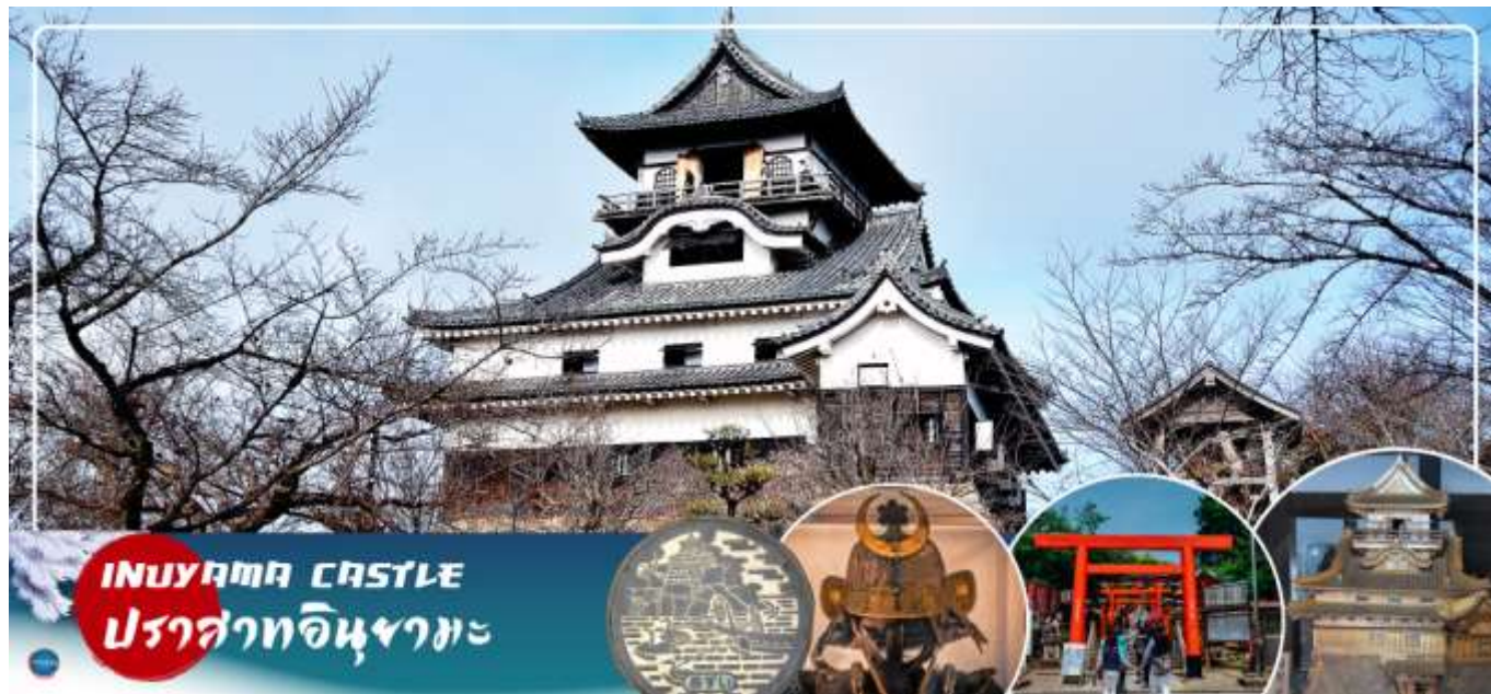
INUYAMA CASTLE ปราสาทอินูยามะ

วันที่สอง ท่าอากาศยานนานาชาติซุบเซ็นแทรร์ นาโกย่า – เมืองอินูยามะ – ปราสาทอินูยามะ(เช้าชม) – ศาลเจ้าซังโคอินาริ – ย่านเมืองเก่าอินูยามะโจคามาจิ – เมืองกิฟุ – อีออน มอลล์