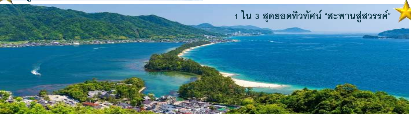
1 ใน 3 สุดยอดทิวทัศน์ "สะพานสู่สวรรค์"