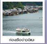
เรือนเรืออ่าวอิเนะ